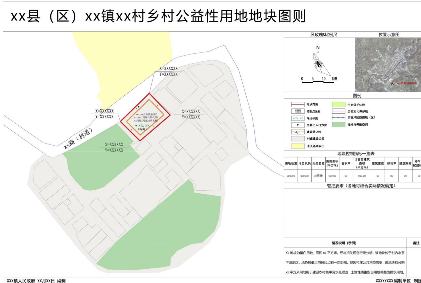
图二：公益性用地地块图则参考样式